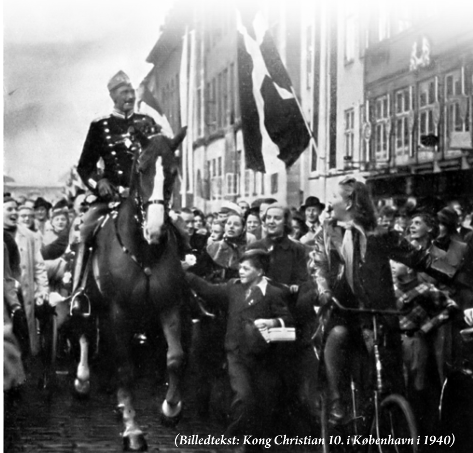
(Billedtekst: Kong Christian 10. i København i 1940)

Menighedsrådet er vært ved et lille traktement, og der er rig mulighed for en god snak til at runde aftenen af.